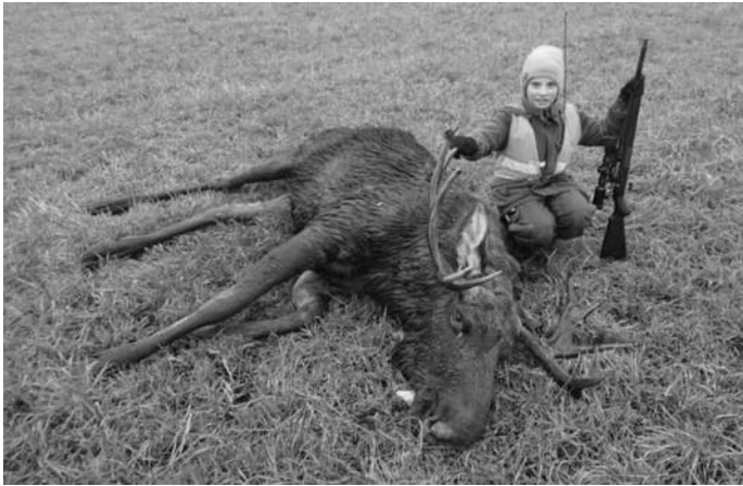
Kuvassa Hermannin ensimmäinen kaato vuonna 2016.

pesiksen ohella pelanneet Alajärven Ankkureissa. Heillä on myös metsästysten tuomarikortti, joten voivat olla tuomareita hirven- ja karhunhaukkukokeissa.